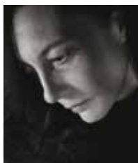
Guadalupe Grande Presentadora/Poeta