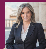
Saluda Milagros Tolón Alcaldesa de Toledo

Celebramos una nueva edición de "Las Noches Toledanas", una edición que este año nos invita a recorrer nuestro Casco Histórico disfrutando de la música en las principales plazas de la ciudad y de numerosas propuestas culturales y artísticas en algunos de los inmuebles y rincones más emblemáticos que aquí se encuentran. En este año 2017,