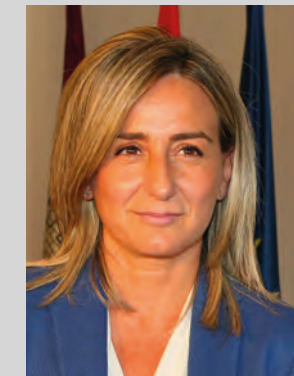
Milagros Tolón Jaime Alcaldesa de Toledo

En 2018 celebramos el Año Internacional del Patrimonio Cultural Europeo. Su objetivo es poner en valor las raíces comunes que han hecho del Viejo Continente una completa unidad en la referencia de nuestros bienes culturales, patrimoniales y artísticos, contribuyendo a ser conscientes de que es mucho más cuanto nos une que cuanto nos diferencia. Durante siglos, Toledo ha sido una ciudad donde las aportaciones de diferentes civilizaciones han contribuido a forjar una identidad cultural propia, sintetizando lo mejor de cuantas civilizaciones pasaron por aquí. La huella de todo esto está bien presente en nuestras calles, nuestros monumentos, nuestros museos y en nuestro día a día. Por eso las Noches Toledanas, convocatoria que contribuye a ensalzar la cultura y el arte de nuestra capital en sus más diferentes aspectos, es una gran fiesta que refuerza esa identidad comunitaria y nos permite conocer mejor la acción creativa de decenas de artistas toledanos contemporáneos. Os animo a todos y todas a ser protagonistas de estas nuevas Noches Toledanas que amplía sus actividades en las plazas del Casco Histórico y que contará con una invitada especial, Gisela, sabiendo que cuanto suceda durante estas horas es ejemplo de lo que nuestra capital aporta, y ha aportado en el tiempo, a la cultura española.